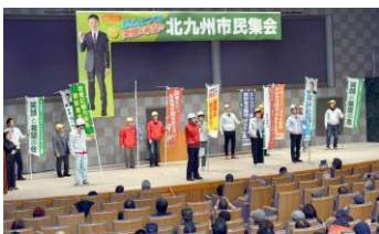
福岡県建設労働組合北九州支部